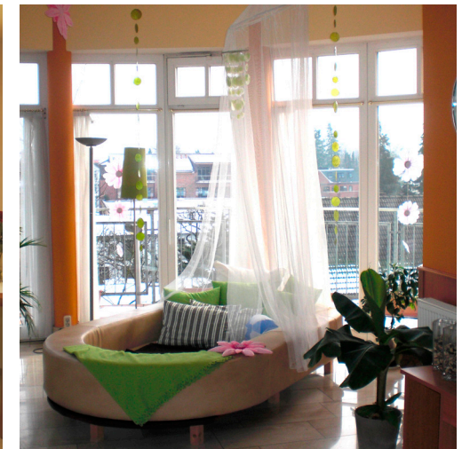
Unsere Wohlfühl-Landschaft lädt zum Verweilen.