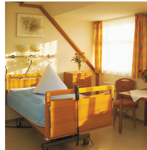
Beispiel eines Bewohnerzimmers